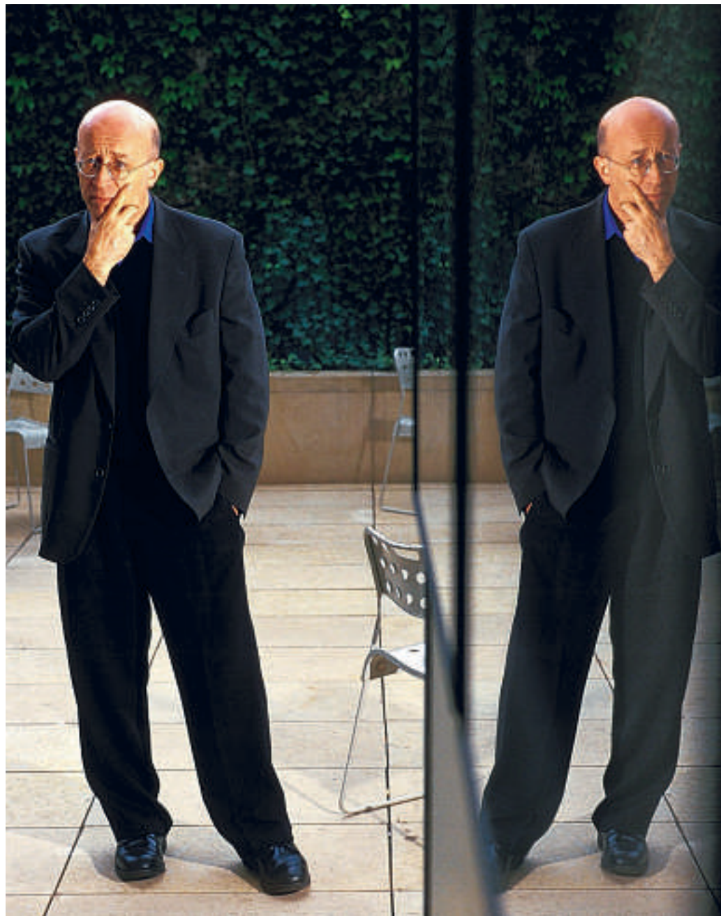
Tony Judt daagt de bestuurders van vandaag uit zich opnieuw de juiste vragen te stellen.